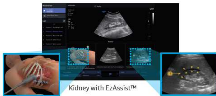
Kidney with EzAssist™